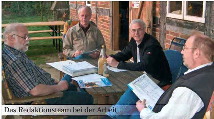
Das Redaktionsteam bei der Arbeit