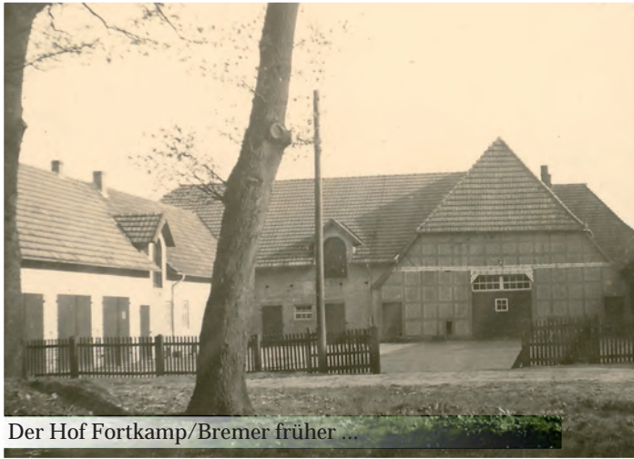
Der Hof Fortkamp/Bremer früher ...