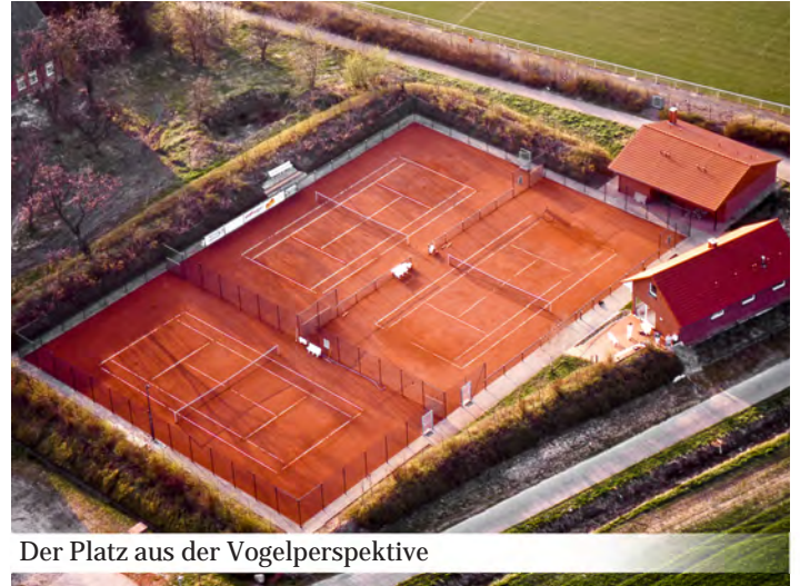
Der Platz aus der Vogelperspektive

Gemäß dem Motto: „Wenn alles offen ist, bricht auch keiner ein“ gab es auch keine Diebstähle in dieser Zeit. 1990 erlangte die Sparte Tennis Eigenständigkeit und wurde so ein eingetragener Verein.