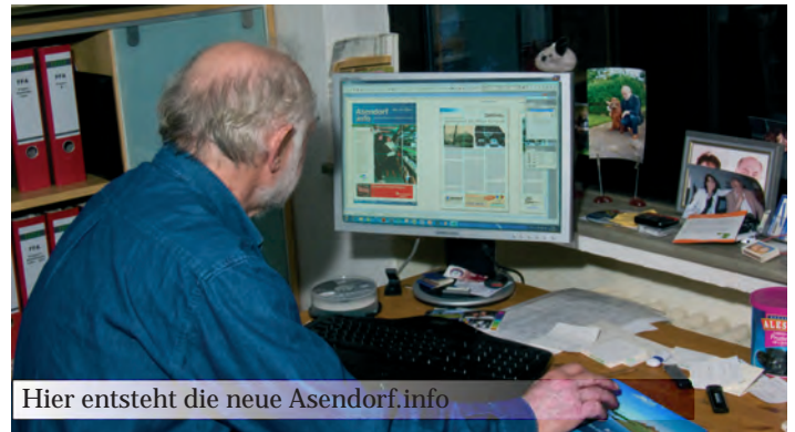
Hier entsteht die neue Asendorf.info

Es ist schon etwas Besonderes, wenn wir heute die 20. Ausgabe der Asendorf.info herausbringen. Kaum jemand hätte gedacht, damals als die Idee geboren wurde, dass wir es schaffen würden so viele Ausgaben mit Leben zu erfüllen, immer neue Themen zu finden, die es wert sind veröffentlicht zu werden.