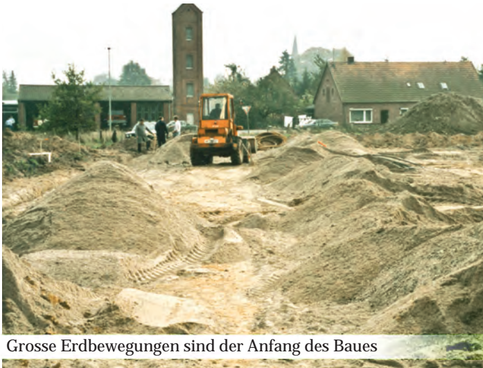
Grosse Erdbewegungen sind der Anfang des Baues