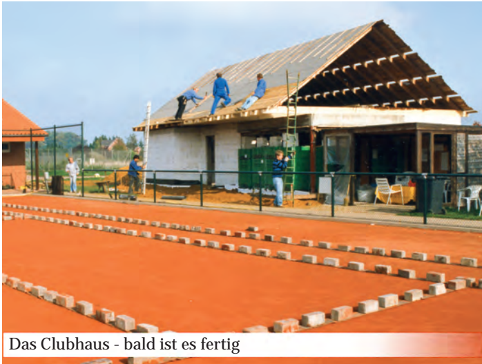
Das Clubhaus - bald ist es fertig